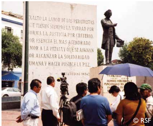
Memorial de los periodistas, México DF

Restablecer la autoridad de la ley, subvertida y mal aplicada, en un contexto de guerra. Resumiendo, ésta es la “ecuación” a cargo de un poder sospechado de infiltración por el crimen organizado. “La inacción de las autoridades sirvieron, y siguen sirviendo de respuesta en muchos casos. Pero la situación es aún peor cuando simulan un ajuste de los casos. Se denigra al periodista, se mancha su reputación para evacuar la pista profesional cuando él es la víctima”. Las organizaciones mexicanas de defensa de la libertad de prensa