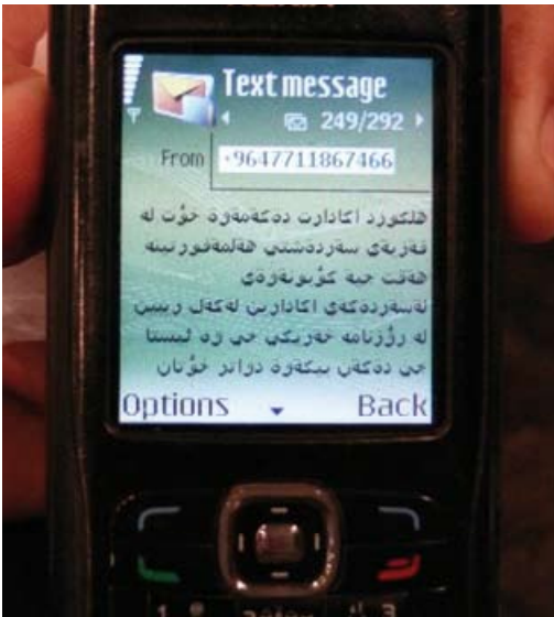
SMS de menaces reçu par un journaliste.

Il est fréquent que les journalistes aillent porter plainte. Mais les autorités n'ont légalement pas le droit de rechercher les auteurs des messages tant que la justice n'a pas été saisie, et que le juge n'a pas formulé de demande, auprès de la compagnie de téléphone. Les personnes qui envoient des messages de menaces utilisent généralement des cartes prépayées, ce qui rend toute tentative de traçabilité impossible.