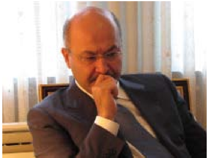
Dr Barham Salih, Premier ministre.

Il a clairement exposé les deux possibilités qui s'offrent aujourd'hui : soit une modification du code de la presse pour le mettre en conformité avec le code pénal irakien, soit une modification du code pénal irakien afin de proposer les mêmes sanctions pour un citoyen et un journaliste, avec en plus une augmentation significative du montant des amendes. Il s'est clairement prononcé en faveur de cette seconde option.